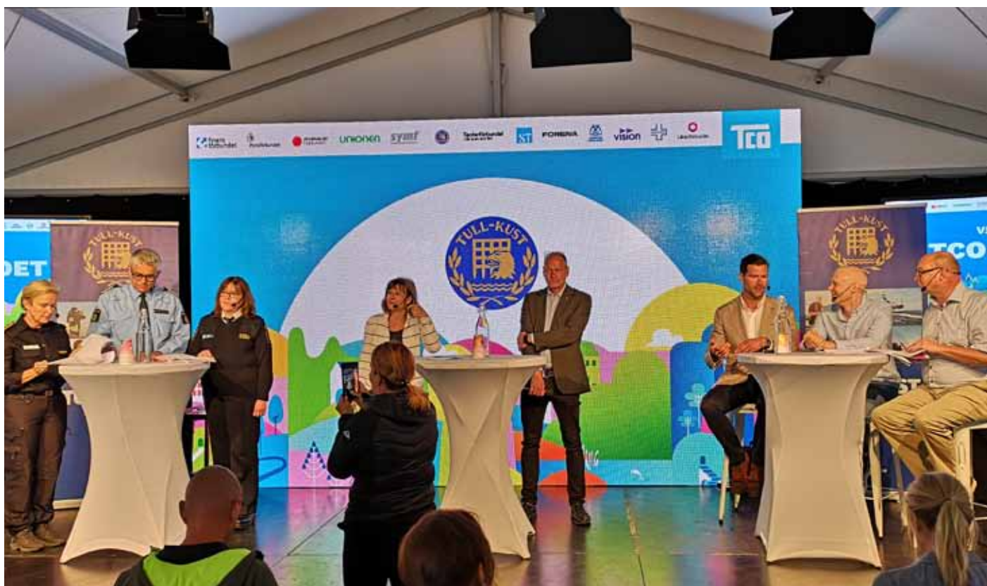
TULL-KUST anordnade för tredje året ett seminarium under politikerveckan i Almedalen.

För tredje året i rad deltog TULL-KUST i Almedalen. Flera möten och ett välbesökt seminarium hanns med under tre intensiva dagar