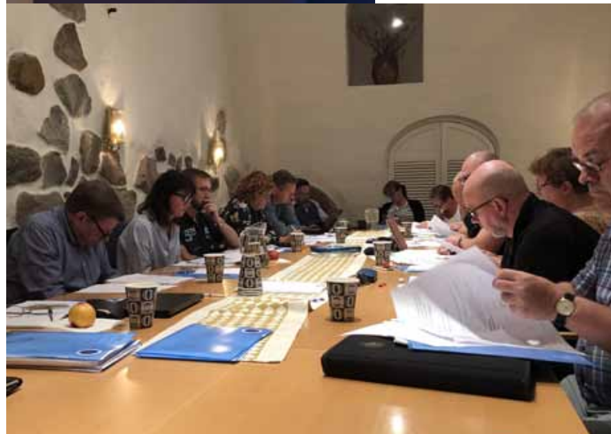
Tullrådet under mötet på TULL-KUSTS kansli i Gamla Stan