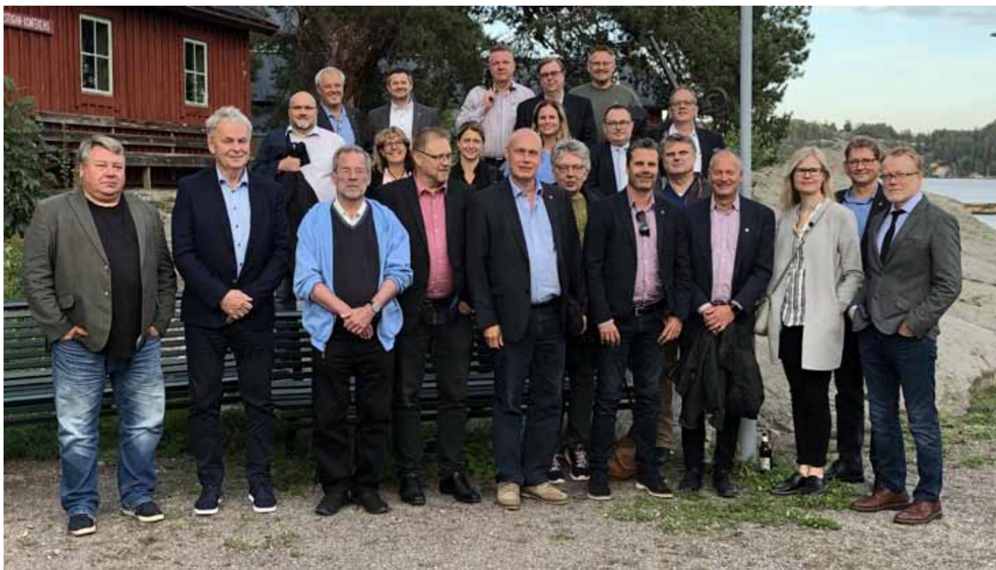
TULL-KUST stod i år värd för det årliga mötet i NTO (Nordiska Tulltjänstemäns Organisation). Här är representanterna från Sverige, Norge, Danmark, Island och Finland samlade i samband med mötet.

V arje höst träffas företrädare för de nordiska tullfacken i NTO, för att utbyta erfarenheter, observationer, arbetsmetoder och för att nätverka.