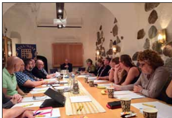
Tullrådet samlat i TULL-KUSTs sammanträdesrum på Västerlånggatan i Stockholm

HR/personalavdelningen har anlitat en extern konsult för uppdraget att tillsammans med de fackliga organisationerna se över våra lokala kollektivavtal. För tillfället är ett nytt Läraravtal prio ett att komma till avslut med. Närmast därefter kommer Flexitidsavtalet och Beredskapsavtalet att diskuteras och förhandlas.